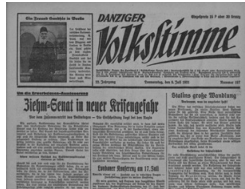
Pierwsza strona „Danziger Volksstimme” z 9 lipca 1931 roku

Następnie gdańszczanie z podszeptu ultranacjonalistów zupełnie już jawnie, bez jakichkolwiek osłonek i z całkowitym cynizmem wypowiadają wojnę Polsce. Tymczasem co prawda w dziedzinie handlu. Oto i centrowa „Landeszeitung”, i hitlerowska „Vorposten” wzywają do bojkotu kupców polskich i żydowskich z Polski pochodzących. Ma to być odpowiedź na antygdańskie wystąpienia w Polsce. Ależ i owszem – nie kupujcie nic u nas – będziemy jednak musieli wówczas pomyśleć nad tym, co mamy zrobić z tymi firmami, w których są zaangażowane kapitały gdańskie. Przecież wiadomo, chociaż nie posiadamy jeszcze odpowiedniej statystyki, że np. cały szereg browarów na Pomorzu to przedsiębiorstwa z gdańskim kapitałem, że w Gdyni istnieje cały szereg firm, gdzie tenże kapitał jest