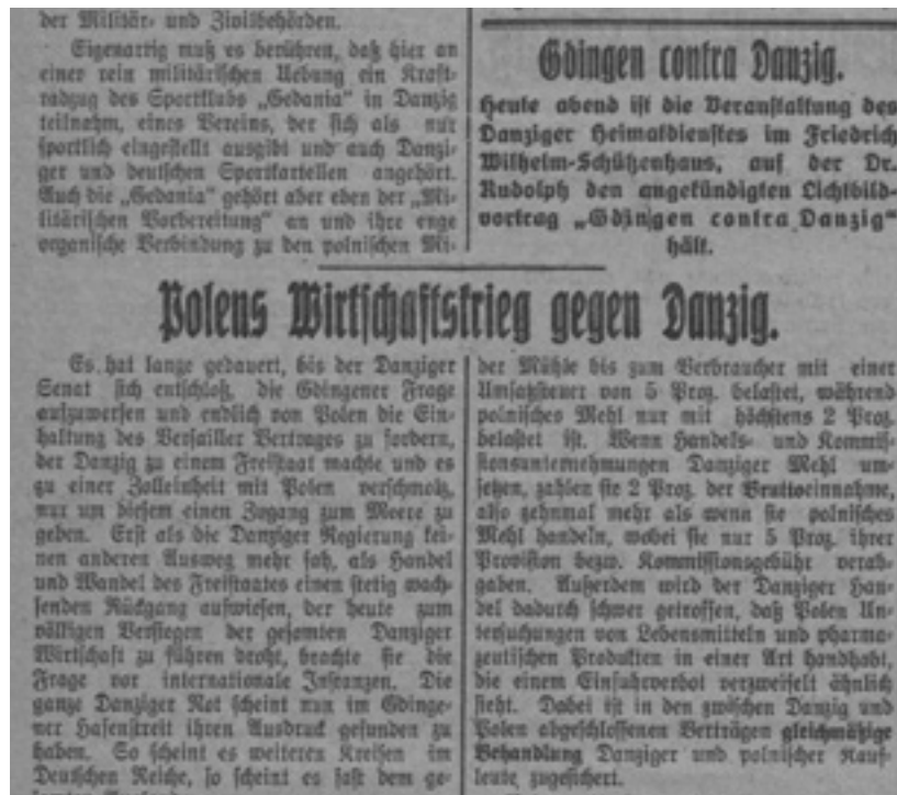
Informacja na temat odczytu Gdingen contra Danzig w „Danziger Allgemeine Zeitung” z 5 maja 1931 roku