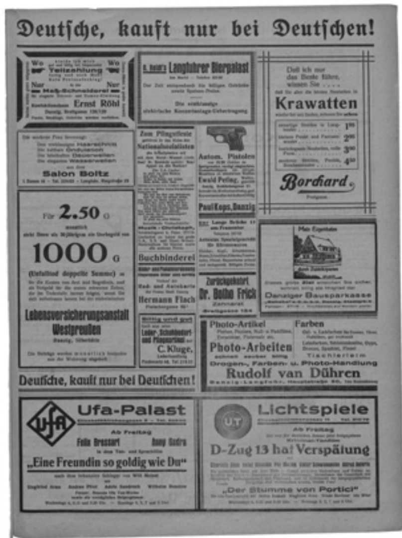
Strona „Vorposten” z hasłem „Niemcy, kupujcie tylko u Niemców!”, 1931

50 Z niemieckiej krwi. 51 Dziś ul. Wojciecha Bogusławskiego. 52 Sąd w składzie jednego sędziego. 53 W 1925 roku doszło do sporu dotyczącego miejsc, w których Poczta Polska w Wolnym Mieście Gdańsku mogła zawieszca skrzynki na listy. Niemiecka większość Wolnego Miasta Gdańska chciała je ograniczyć do terenu portu, podczas gdy Polacy domagali się dostępu do skrzynek w całym mieście, co ostatecznie udało im się osiągnąć. W mieście wisiało ogółem 10 skrzynek pocztowych z godłem Rzeczypospolitej Polskiej oraz informacją, że są one przeznaczone tylko na przesyłki pocztowe do Polski. Skrzynki te często były niszczone lub oblewane farbą przez Niemców.