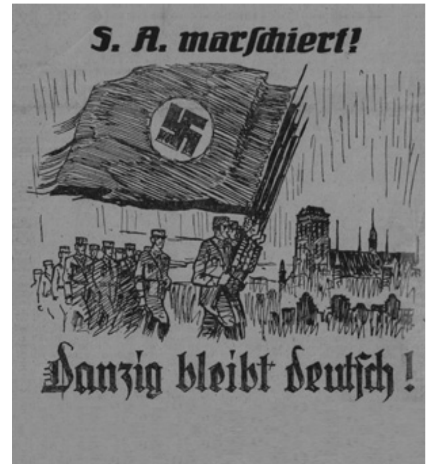
Propagandowy rysunek z hasłem „Gdańsk zawsze niemiecki”, „Vorposten” z 6 lutego 1931 roku