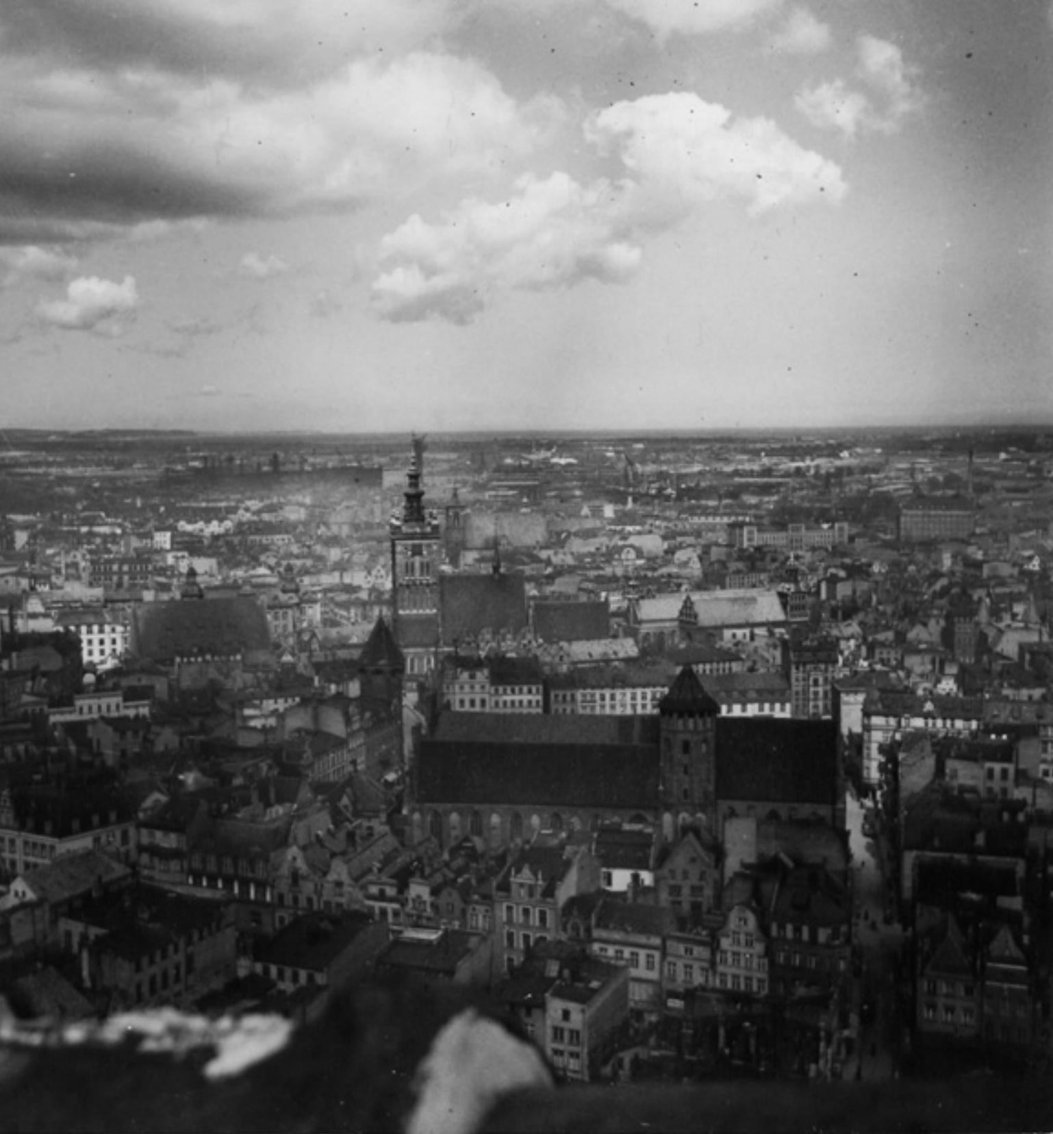
Panorama Gdańska, 1930