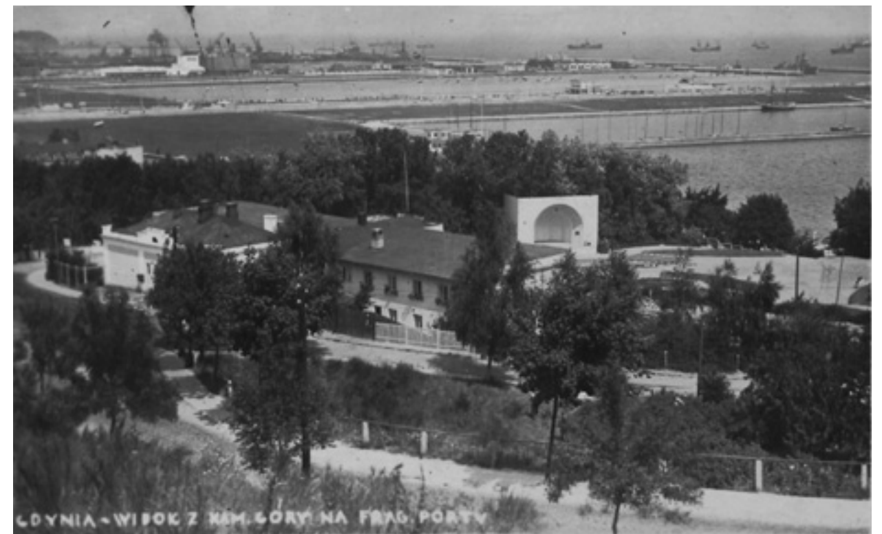
Widok na port w Gdyni z Kamiennej Góry, lata 30.