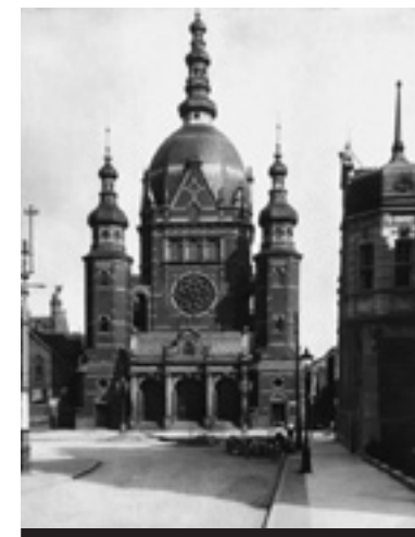
Wielka Synagoga, widok od strony zachodniej, około 1905

Jednocześnie dzisiejsza „Vorposten” zapowiada na 22 maja dwa zebrania hitlerowców – jedno w Sopocie,