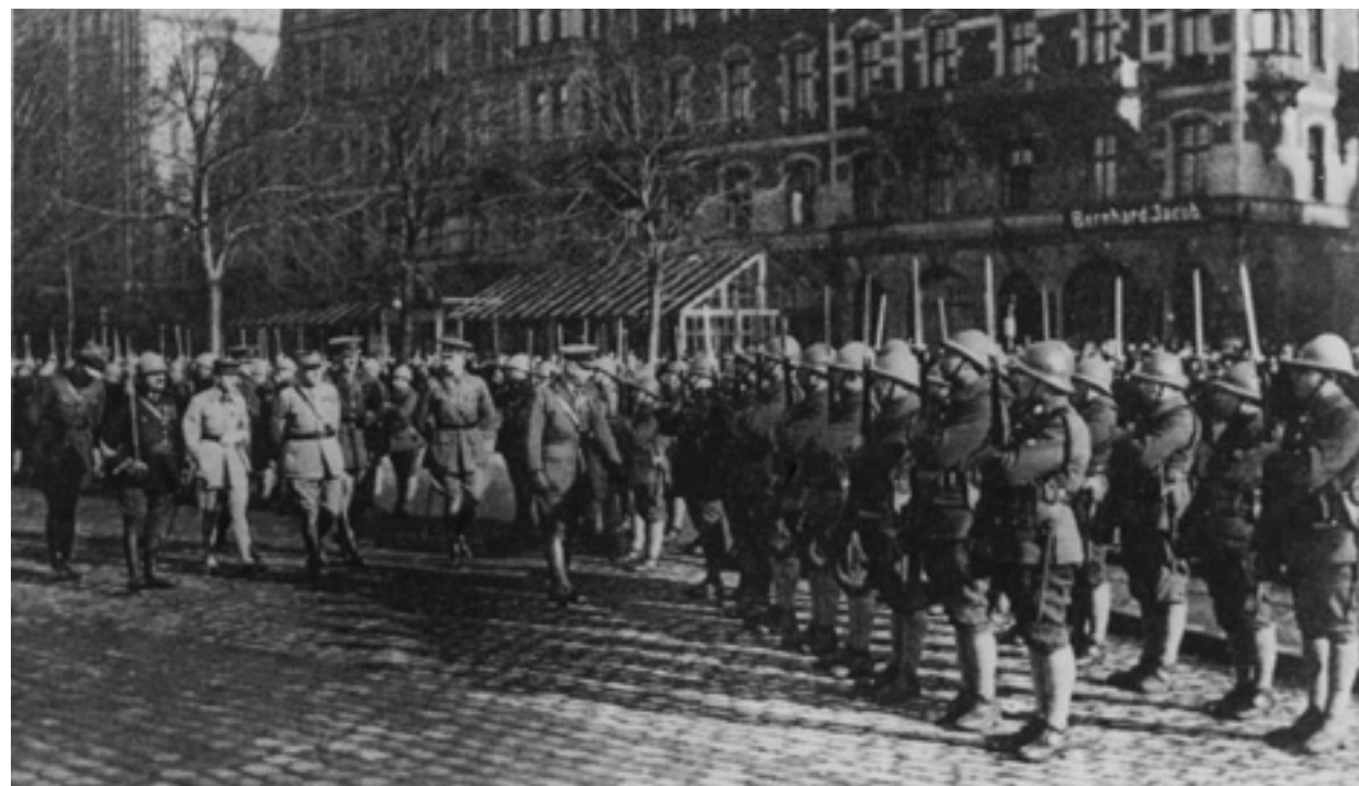
Wojska alianckie w Gdańsku

Dla utrzymania porządku stacjonowały w Gdańsku dwa bataliony wojsk alianckich – jeden angielski, drugi francuski – które pozostawały