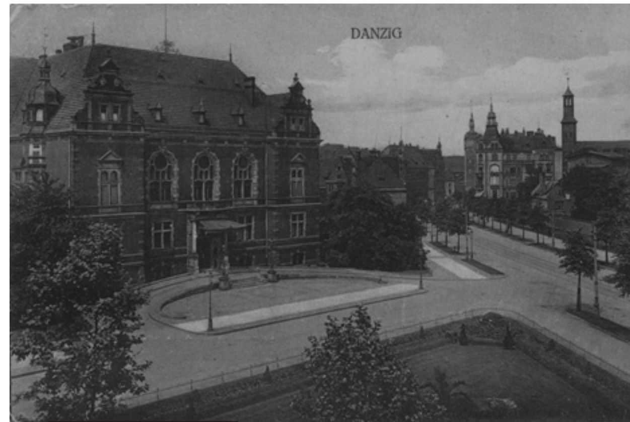
Siedziba Wysokiego Komisarza Ligi Narodów przy dzisiejszej ulicy Wały Jagiellońskie 1

28 August Wilhelm von Hohenzollern (1887–1949) – syn cesarza niemieckiego Wilhelma II. W 1930 roku wstąpił do SA. Doszedł do rangi Obergruppenführera.