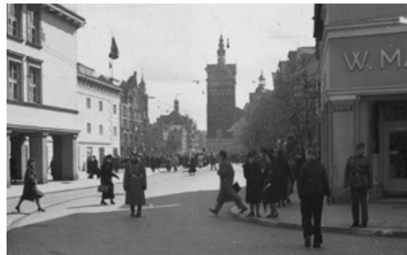
Widok na Targ Węglowy i wieżę Katowni