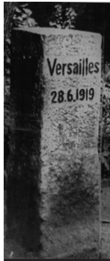
Wersalski kamień graniczny