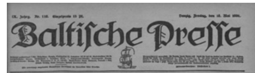
Nagłówek „Baltische Presse”