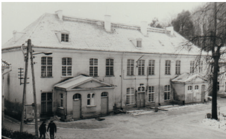
ilustracja nr 160. Dwór II, dziedziniec i oficyna południowa, 1987.