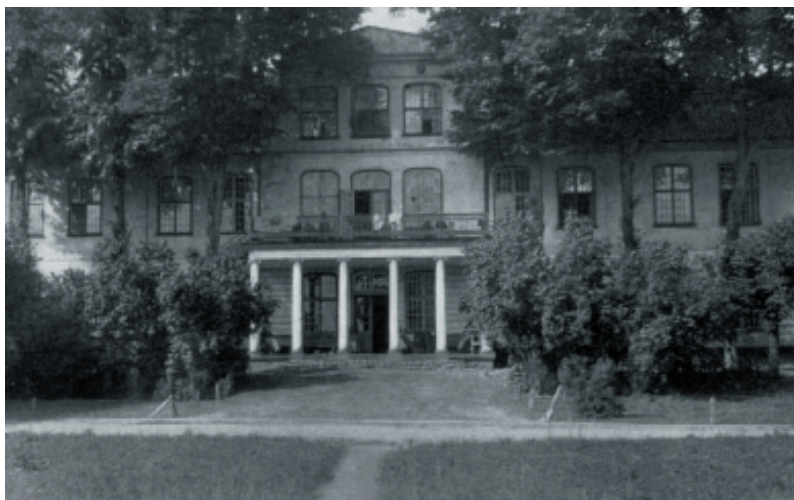
ilustracja nr 158. Dwór II, fasada wschodnia pałacu, fot. 1925.