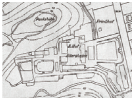
ilustracja nr 155. Dwór II, plan zespołu w 1936 roku.

W styczniu 1833 roku rozpoczęto remont, mający na celu przystosowanie budynków do nowych funkcji. Przewidywany koszt adaptacji wynosił 14 500 talarów, lecz jej zakres stopniowo rozszerzano. Roboty prowadzone jeszcze w 1835 roku objęły zasięgiem większość obiektów podworskich 13 .