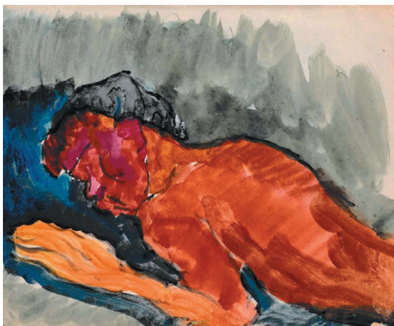
Opalająca się, lata 30., papier, akwarela.